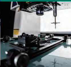
Macchine di misura ottiche