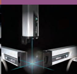
Linear Scales e sistemi DRO