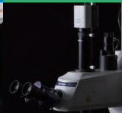
Strumenti di misura ottici