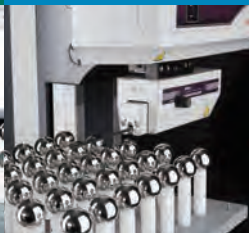
Strumenti di misura della forma