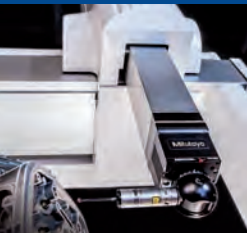
Macchine di misura a coordinate